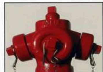
Bocas 15° inclinadas (Evita o colapso da mangueira)