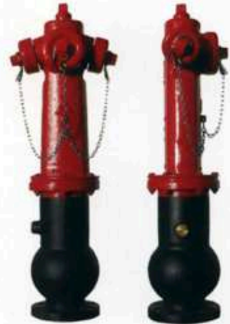
Disponível em 3" (80mm) e 4" (100mm) com qualquer tipo de flange

Rua da República, Nº 270 (EN 109 Cacia) - Apartado 761 3801-801 Aveiro Telf.: 234-910840 Fax: 234-910845 e-mail: instalfogo@instalfogo.pt Web: www.instalfogo.pt